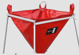
Montage de l'entonnoir sur les crochets dans les angles du chevalet est rapide et facile